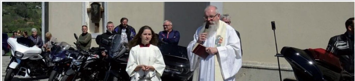
„Motorradsegnung“ 01.05.2026 auf den Kirchbüchl